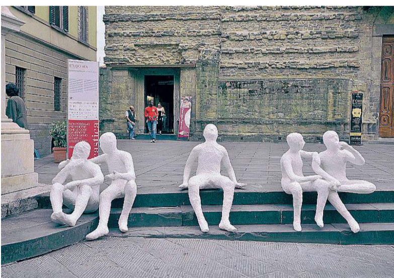
StudioAfa «Esperimento di manutenzione urbana» (Icastica 2014, Arezzo).